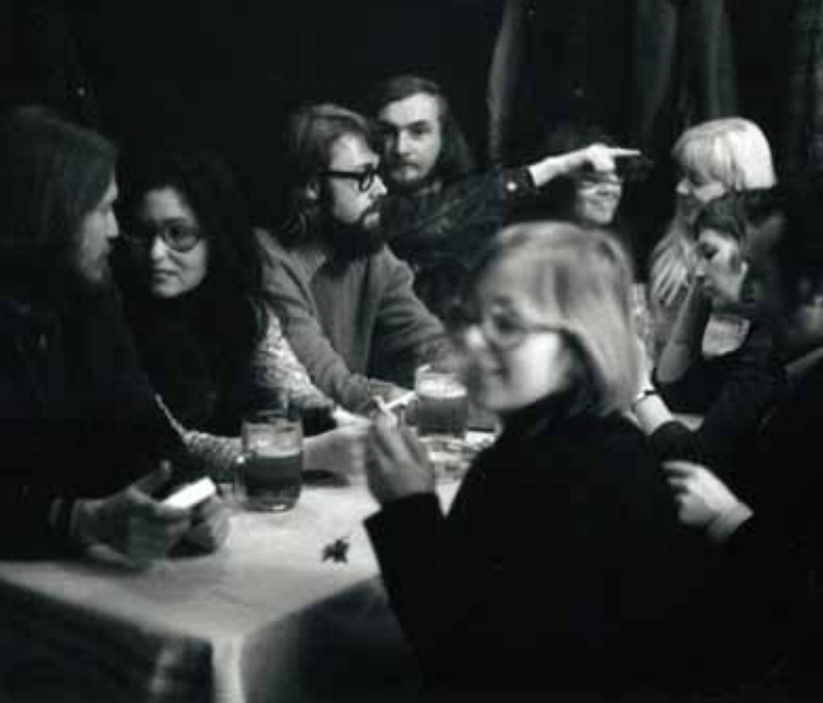
Akce KŠ, Křížovníký kalendář č. 5 , hospoda U Regenta, 1972