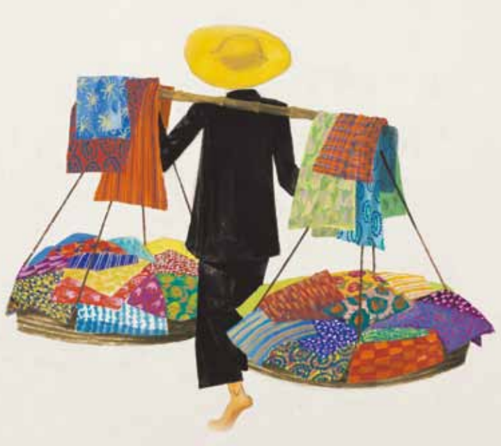
Miroslav Šašek, ilustrace z knihy This is Hong Kong 1965